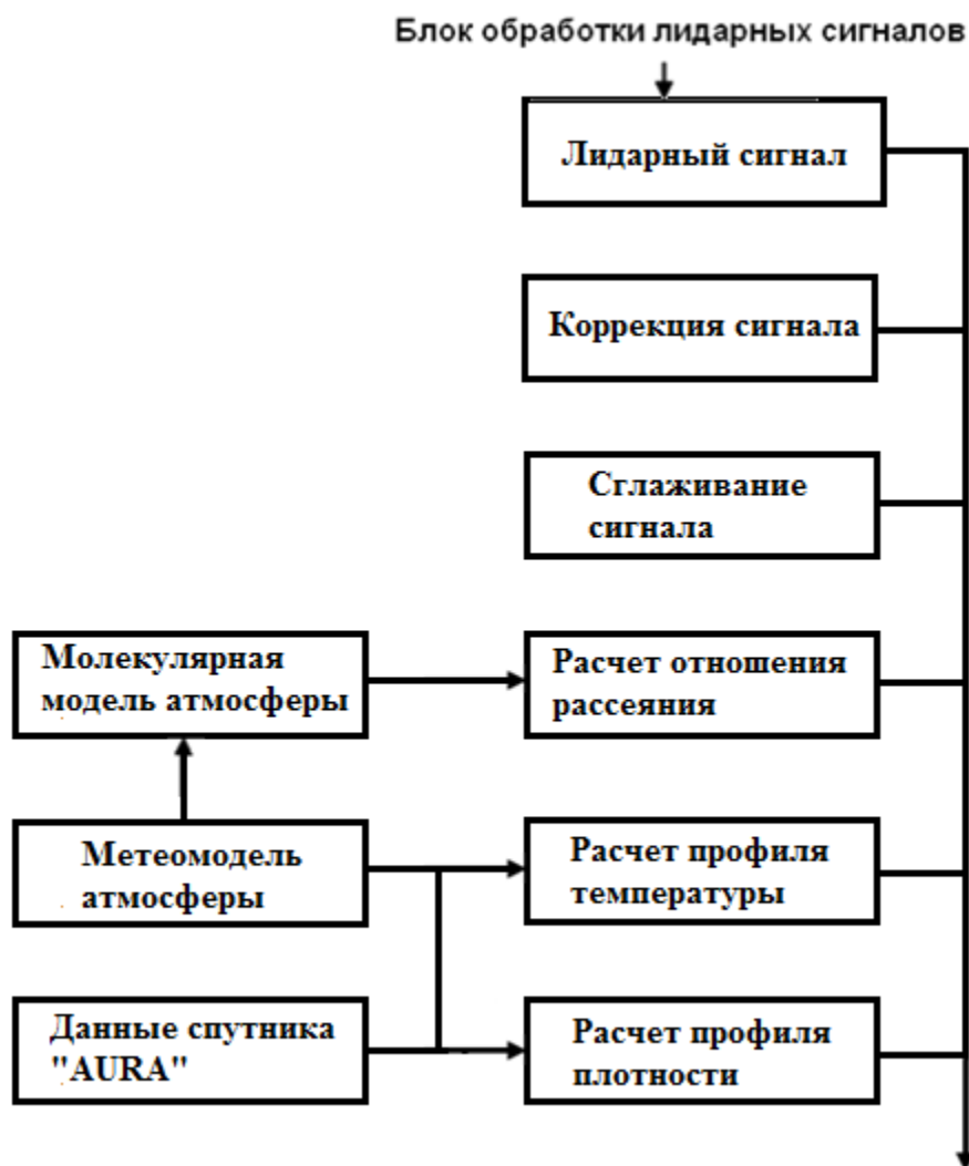
Рис. 1. Блок-схема алгоритма обработки лидарных сигналов.